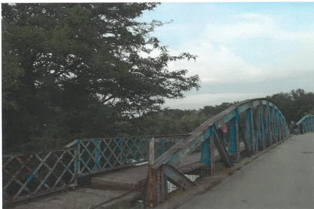
POD BIZETZ, GIURGIU, 2020