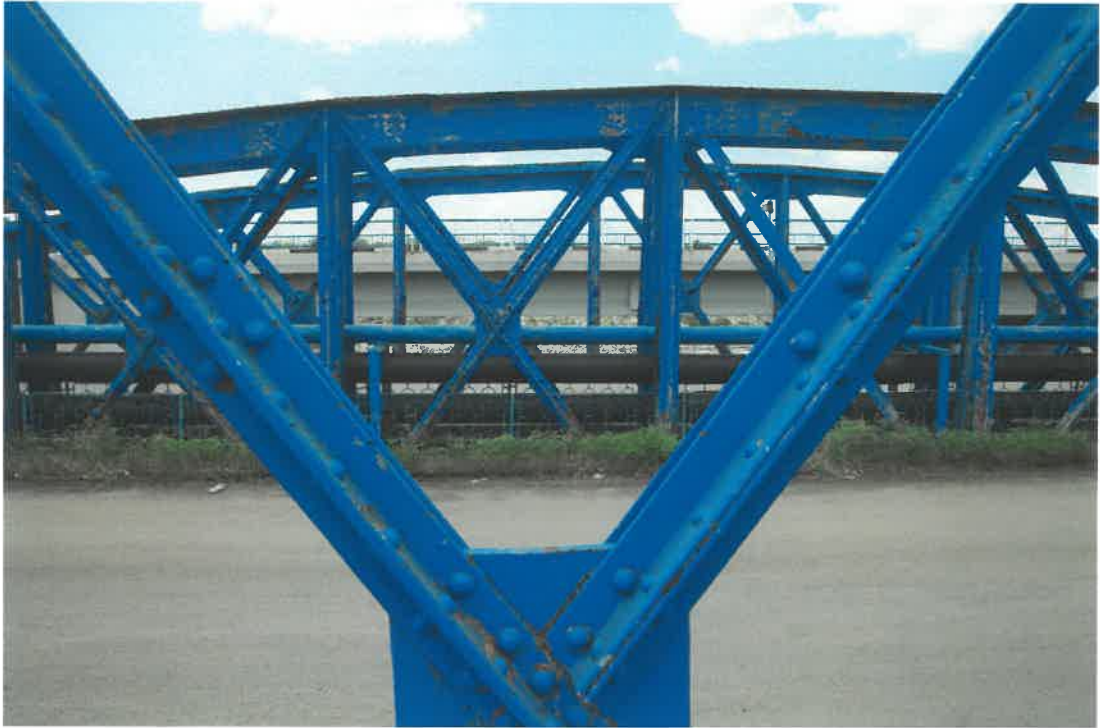
POD BIZETZ, GIURGIU, 2019